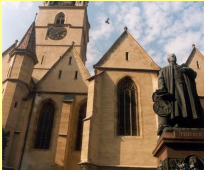
Denkmal für Georg Daniel Teutsch in Hermannstadt